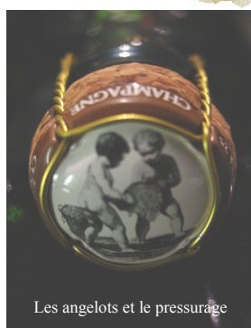
Les angelots et le pressurage